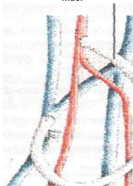
Példa egy műeres fisztulára a könyökhajlatban