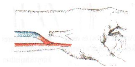
Egy artéria és egy véna közvetlen összeköttetése (Cimino-fisztula) az alkar belső oldalán

A műtétet általában helyi, vagy a karra kiterjedő érzéstelenítésben végezzük (altatásban ritkán). Az érösszeköttetést rendszerint az alkaron, illetve csuklótájékon készítjük (ezt nevezzük Cimino-fisztulának). Amennyiben az alkaron, vagy a csuklótájékon levő artériák és vénák nem megfelelőek, akkor a könyökhajlatban, a felkaron vagy a lábon keresünk a műtét szempontjából alkalmasabb ereket.